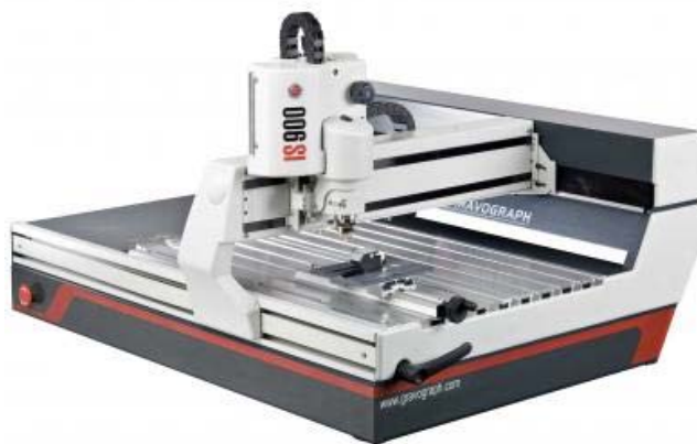
MÁQUINA IS900 CON TORNO