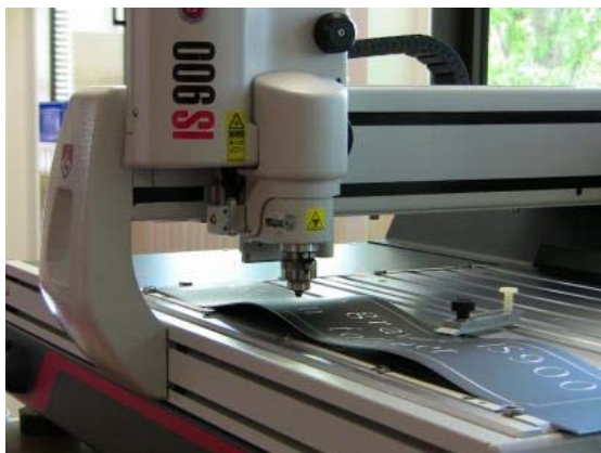
FUNCIÓN 'TERRAIN FOLLOWER'